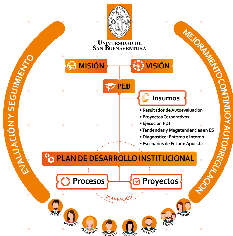
Figura 1. Modelo de gestión_USB (2015)

La Universidad de San Buenaventura cuenta con lineamientos para el aseguramiento de la calidad y con un modelo de gestión que declara en su Informe de Autoevaluación Multicampus y que busca conciliar los lineamientos y prácticas que se desarrollan en cada una de las seccionales. Dicho modelo establece una serie de pautas para llevar a cabo la gestión eficaz en la Universidad y que permiten guiar la práctica y asegurar que se cumplen los principios básicos de excelencia y es fundamental como una herramienta de autoevaluación. A continuación su representación gráfica: